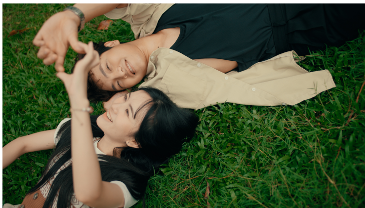
MV “Anh không yêu mùa xuân” thể hiện chuyện tình của đôi bạn trẻ yêu nhau nhưng cuối cùng lại không đến được với nhau.