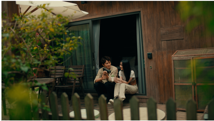
MV “Anh không yêu mùa xuân” cảnh quanh lãng mạn, trong trẻo

Vốn dĩ hầu hết những ca từ của anh Trung viết trước khi lên khuôn nhạc đã là những vần thơ hết sức dung dị. Nên khi nhạc sĩ gửi bài hát bao giờ cũng sẽ nói: Nếu em thấy thích thì hãy hát!. Mỗi khi nhận bài hát từ nhạc sĩ, tôi vừa trăn trở vừa háo hức vì phải làm sao qua ca khúc “nói hộ” được nỗi lòng của nhạc sĩ với người yêu nhạc, còn háo hức là được thoải mái sáng tạo ca khúc của nhạc sĩ mà không lo bị la mắng hay “chấn chỉnh” vì có đôi lúc tôi cũng mạnh dạn “cãi” để làm sao ra được sản phẩm âm nhạc mà cả nhạc sĩ và tôi ưng ý nhất”, ca sĩ Tô Ngọc Hà cho hay.