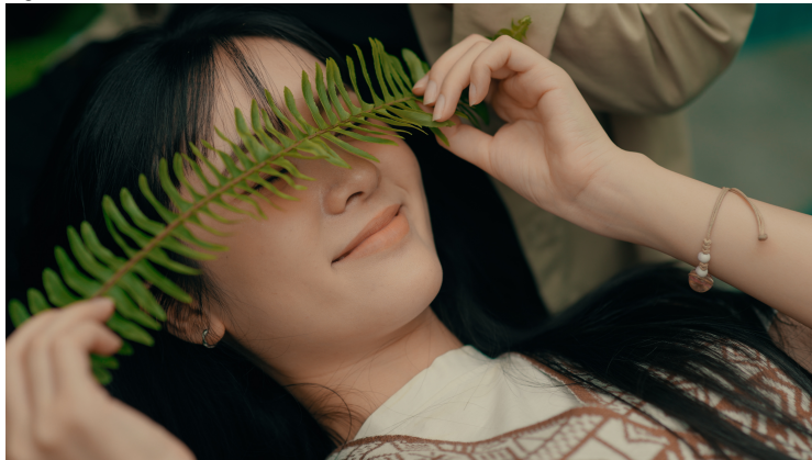
Một cảnh trong MV “Anh không yêu mùa xuân”