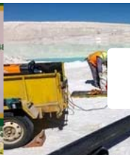
Nước châu Á phát cấm vận phương tiện về tay... Trung Quốc