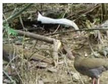
"Gà sách đỏ" được phát hiện ở Thanh Hóa

Đọc thêm về: tô điệp hà , mv kẹp tóc màu xanh