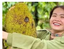
Cô nông dân 'triệu view'