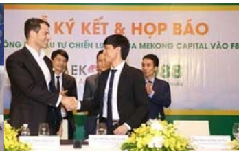
Quý đầu tư rút hàng chục triệu USD nói gì khi F88 bị khám xét trụ sở, chi nhánh tại TP HCM?