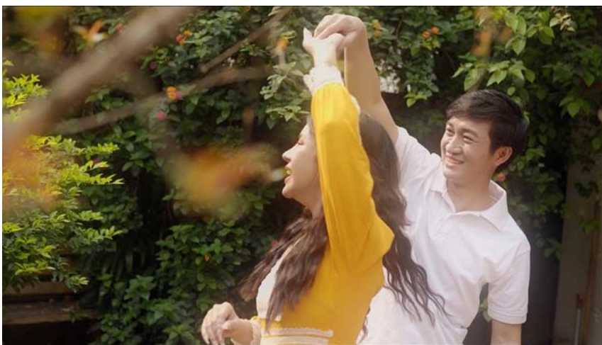
Hình ảnh trong MV "Kẹp tóc màu xanh".