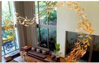
Các căn siêu biệt thự ở Việt Nam thường không thể thiếu thứ này: Giá trị cả tỷ đồng, nặng hàng tấn nhưng phải lắp thủ công rất cầu kỳ