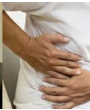
Căn bệnh ung thư lệ tử vong cao: 5 d báo đỏ' cần lưu ý