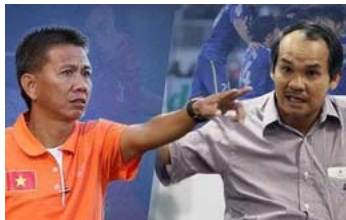
Đằng sau 'lời tiên tri' ứng nghiệm của bầu Đức là nỗi buồn chia cắt của bóng đá Việt Nam