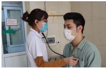
Sốt cao, đau đầu, nam thanh niên đi khám và phát hiện mắc căn bệnh chẳng ngờ tới