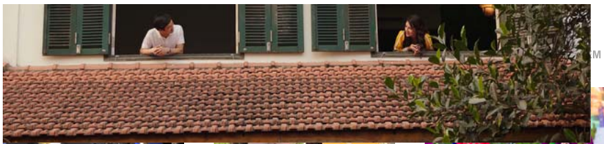
Cảnh trong Kẹp tóc màu xanh