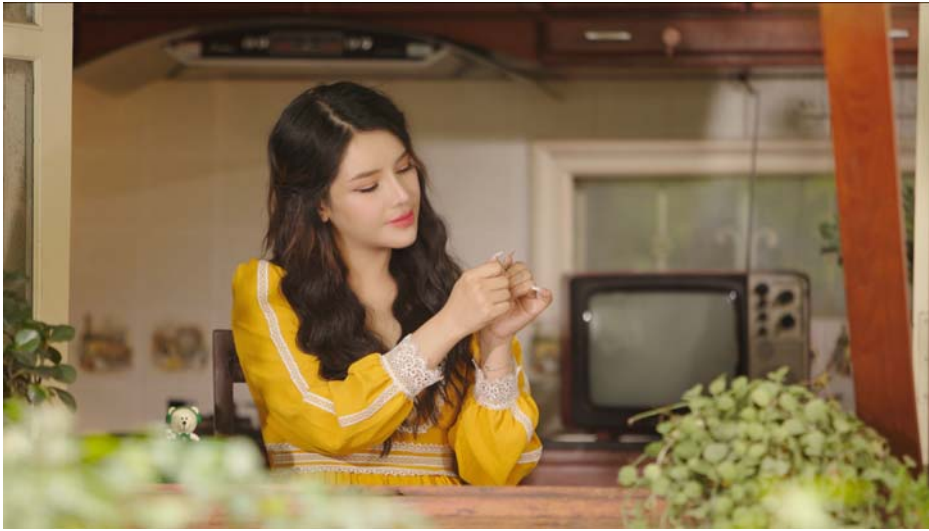
Cảnh trong MV "Kẹp tóc màu xanh".