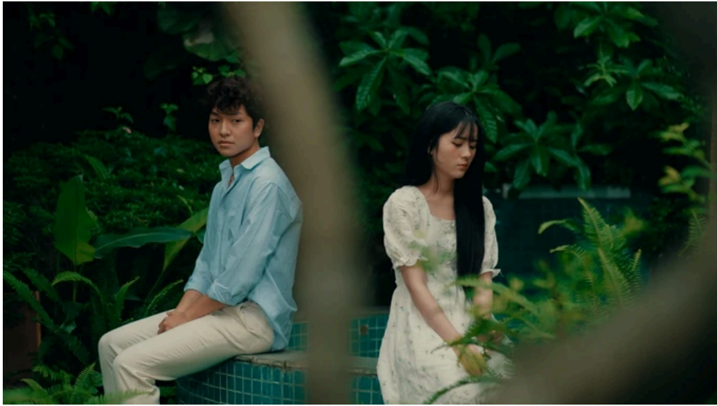
Cảnh trong MV