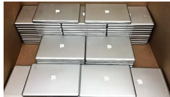
Hà Nội : Máy tính xách tay chưa bán được đang được bán với giá rẻ