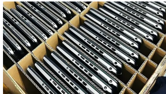
Hà Nội : Giảm giá cho máy tính xách tay đã qua sử dụng!