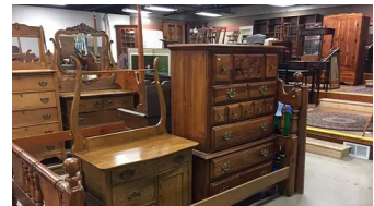
Hà Nội : Đồ nội thất đã qua sử dụng đang được bán với giá siêu rẻ!