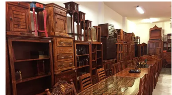
Hà Nội : mua đồ nội thất đã qua sử dụng với giá rẻ