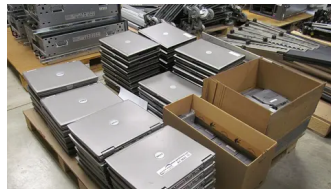
Giá cho máy tính xách tay chưa bán có thể khiến bạn ngạc nhiên