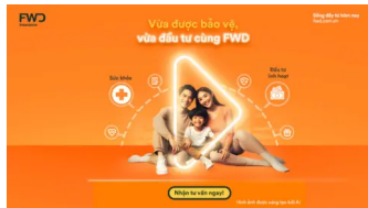
FWD bộ 3 bảo vệ - An tâm sức khỏe, an toàn đầu tư