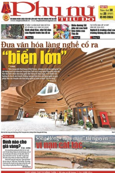
Báo Phụ nữ Thủ đô 20-24 số 1727