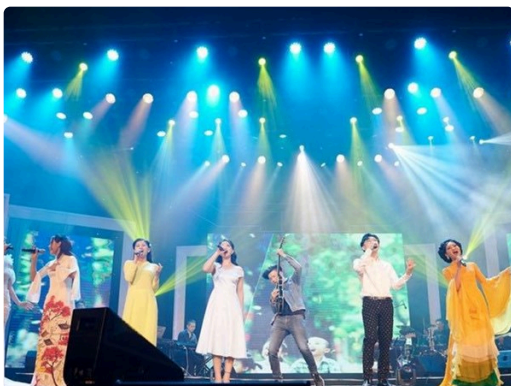
Tổ chức Cuộc thi “Giọng hát hay Hà Nội năm 2024”