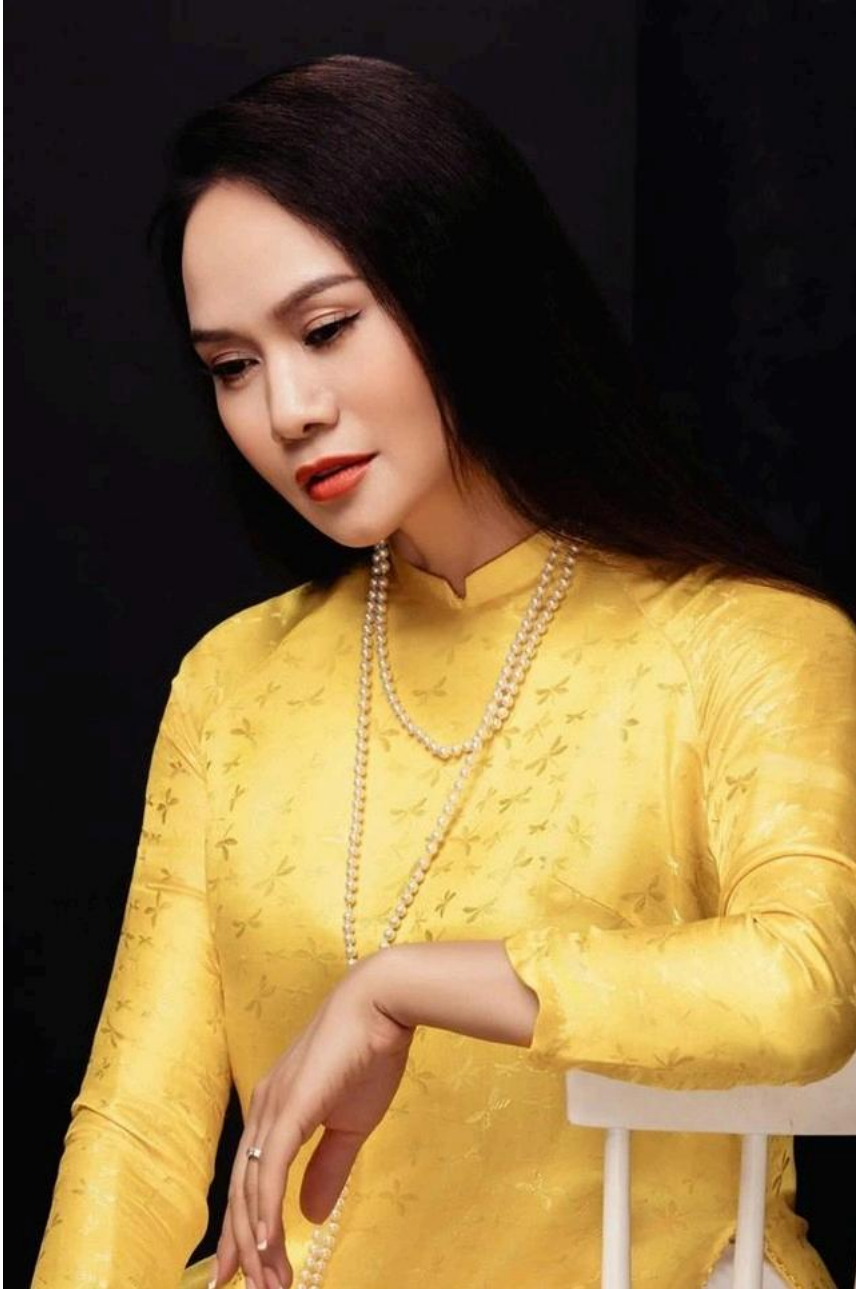
NSND Mai Hoa hát "Café phố" trong album