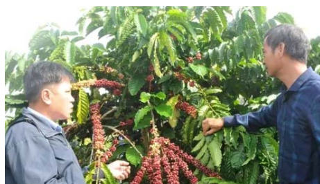
Đắc Nông nâng giá trị cà phê qua các dự án