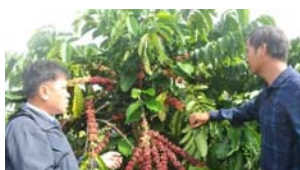
Đắc Nông nâng giá trị cà phê qua các dự án