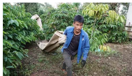
Rộn ràng cà phê mùa thu hoạch