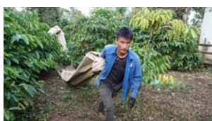
Rộn ràng cà phê mùa thu hoạch