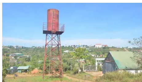
Tái sinh những công trình nước sạch ở Đắc Nông