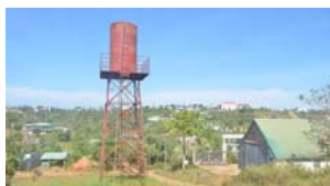
Tái sinh những công trình nước sạch ở Đắc Nông