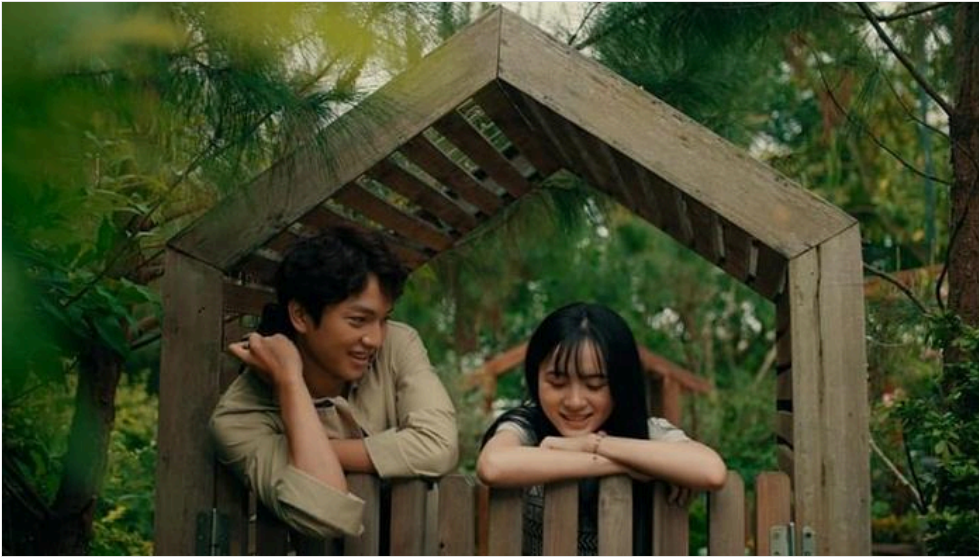
Hình ảnh của Á quân Thần tượng Bolero trong MV mới nhất