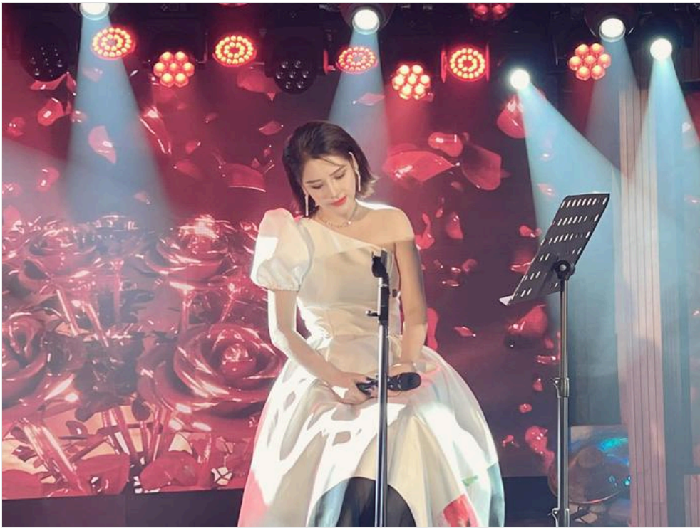
Vẻ đẹp của Á quân Thần tượng Bolero khi đứng trên sân khấu khiến khán giả không thể rời mắt.

Xem thêm clip: Những khoảnh khắc ấn tượng của các huấn luyện viên Thần tượng Bolero [SAOSTAR.VN]