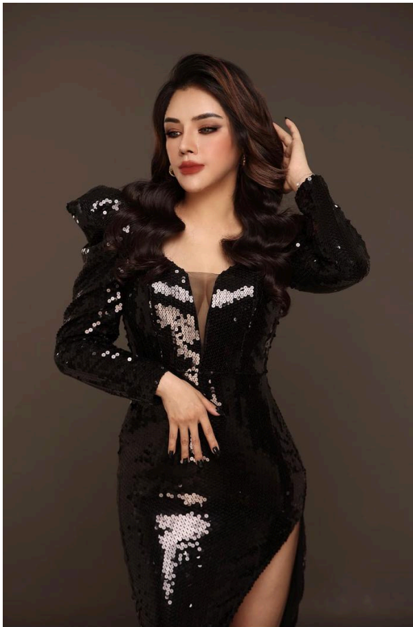
Á quân Thần tượng Bolero thường thực hiện một số bộ ảnh chín chu, chuyên nghiệp.