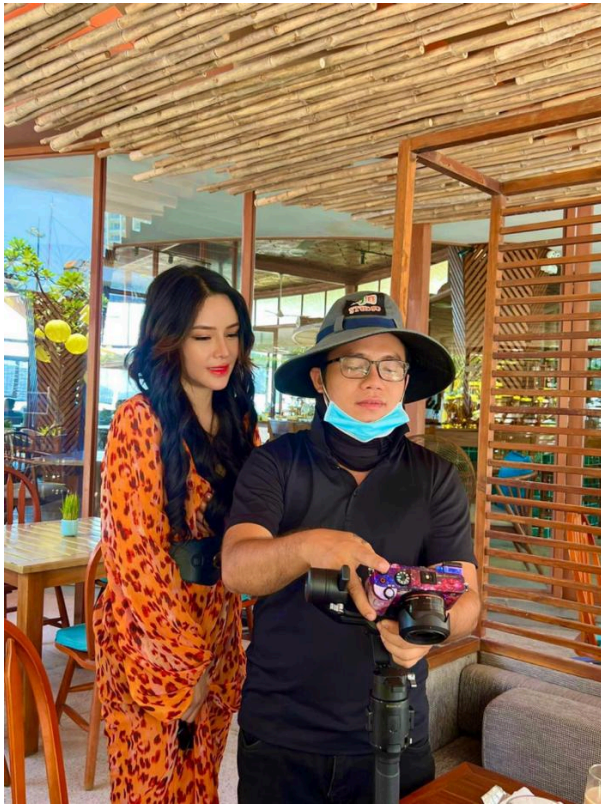
Ở hậu trường, Á quân Thần tượng Bolero vẫn nổi bật nhờ diện mạo ưa nhìn.