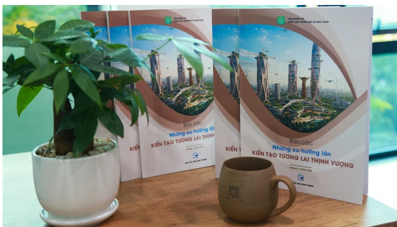
Cuốn sách “Những xu hướng lớn: Kiến tạo tương lai thịnh vượng”