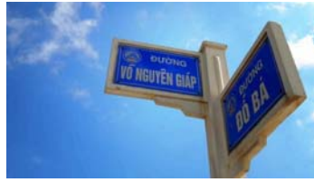
Lắp đặt mã QR Code giới thiệu thông tin tên đường trên địa bàn toàn TP Đà Nẵng