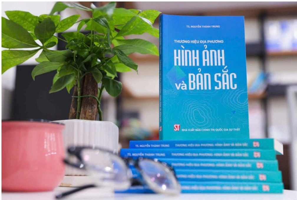
Ra mắt sách "Thương hiệu địa phương: Hình ảnh và bản sắc".

Cuốn sách nhằm cung cấp thêm tài liệu nghiên cứu, tham khảo cho các nhà hoạch định chính sách, cán bộ quản lý Nhà nước tại các địa phương, cán bộ giảng dạy trong các cơ sở đào tạo và bạn đọc quan tâm đến vấn đề này.