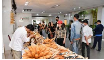
TP.HCM sắp diễn ra Lễ hội Bánh mì lần 2 năm 2024