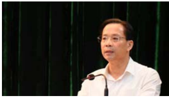
Gới thiệu nhân sự kiện toàn chức danh Bí thư Tỉnh ủy Lạng Sơn