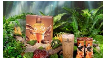
Cần mạnh tay xử lý tình trạng lợi dụng mạng xã hội để “bóc phốt” sai sự thật