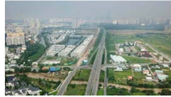
Chỉ đạo đúng đắn về quy hoạch địa phương