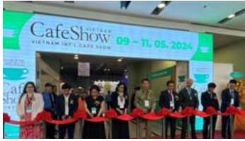
Hàng trăm thương hiệu hội tụ tại Triển lãm quốc tế Cafe Show 2024