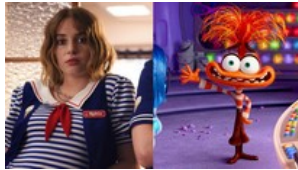
"Những mảnh ghép cảm xúc 2": Rực rỡ niềm vui, đong đầy cảm xúc