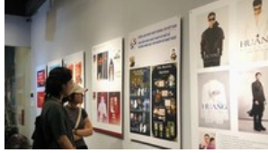
Triển lãm đầu tiên về nghệ thuật thiết kế quảng cáo Việt Nam