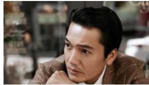
Diễn viên Quang Tuấn: Cứ nỗ lực hết mình, mọi thứ sẽ về đúng giá trị