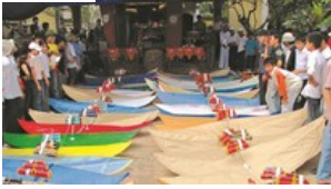
Cuộc thi video clip ""Khám phá - Check in Đan Phượng""