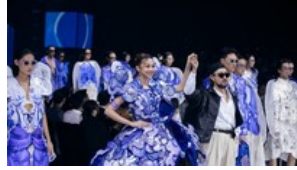
Thanh Hằng "lỗ vốn" khi sắm giày mới đi diễn thời trang