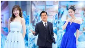
Trường Giang được "chọn mặt gửi vàng" show giải trí kết hợp mua sắm đặc sắc