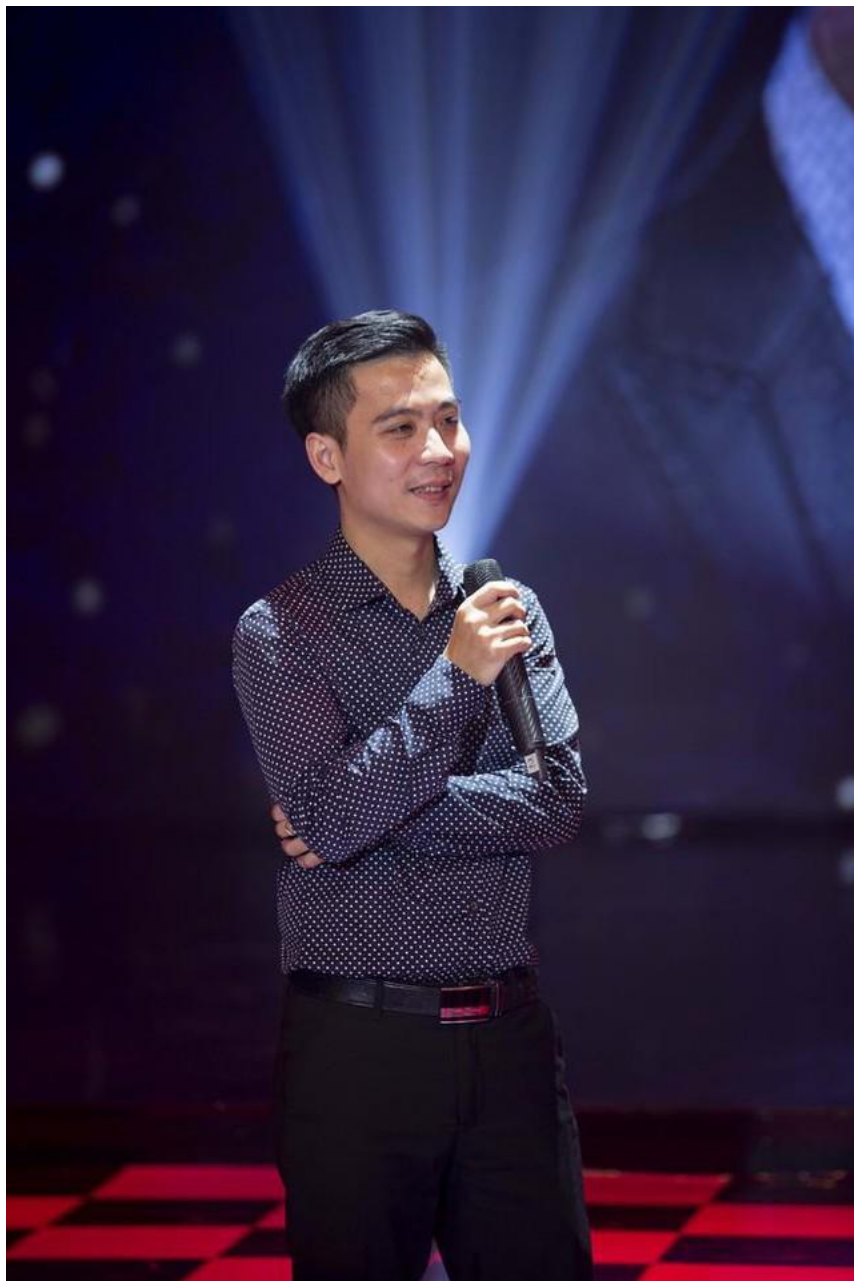
Nhạc sĩ Thành Vương