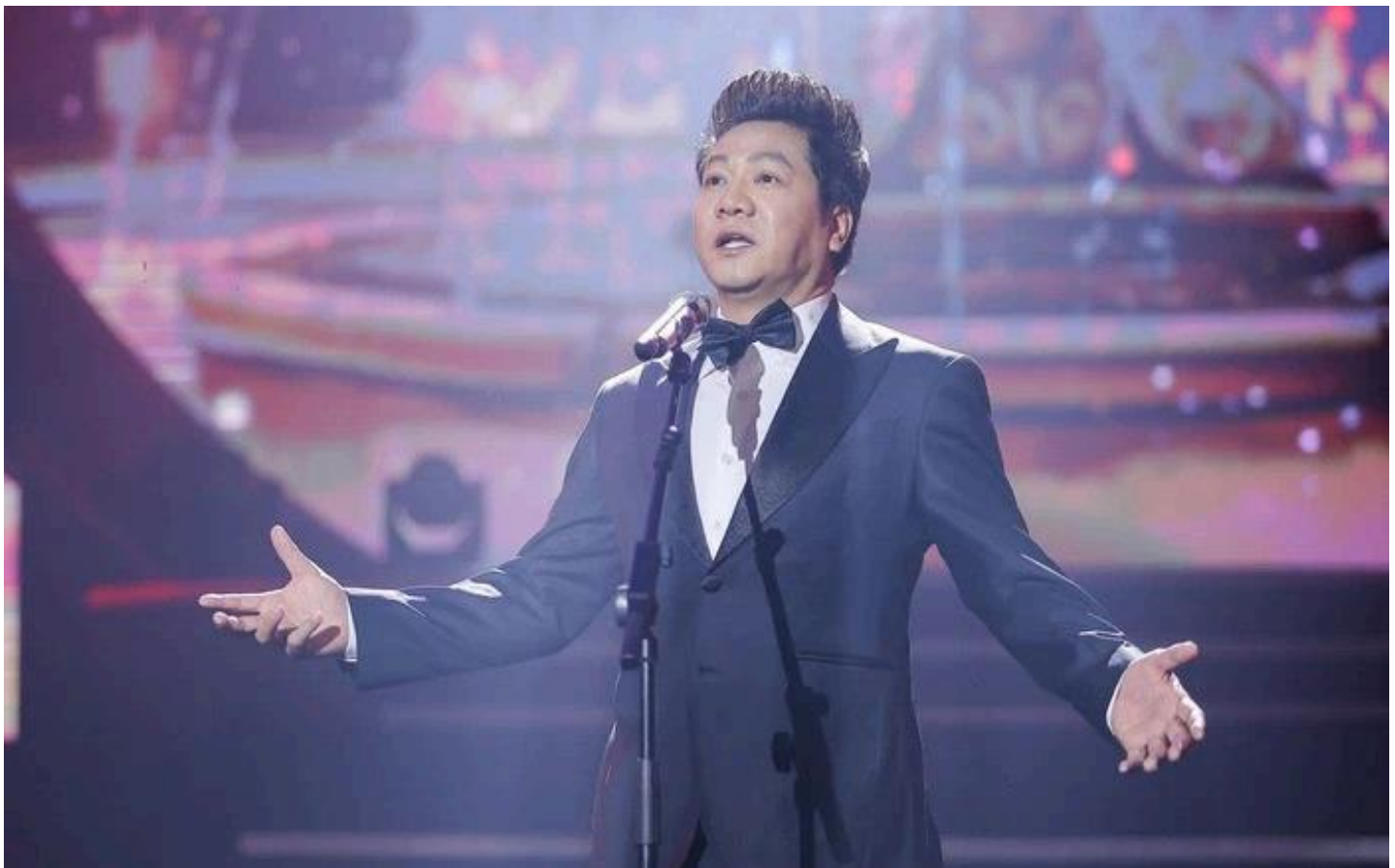
NSND Quốc Hưng.

Nhạc sĩ Nguyễn Thành Trung vừa công bố 3 tác phẩm mới sáng tác Đất nước yêu người , Xin rạng ngời và Đất nước vươn mình để mừng Đảng, mừng xuân, mừng Tổ quốc vươn mình trong kỷ nguyên mới. Các tác phẩm được 2 giọng ca hàng đầu của dòng nhạc thính phòng Việt Nam là NSND Quốc Hưng và NSUT Đăng Dương trình bày.